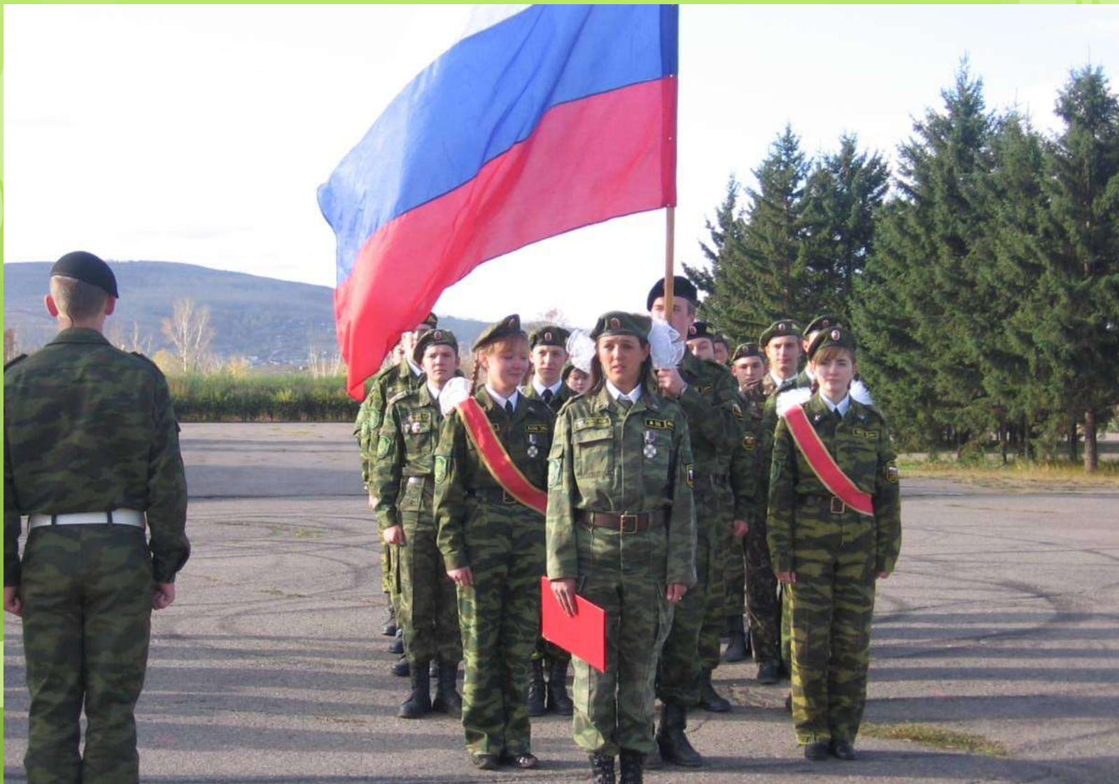
Казаки кадеты – участники смотра почетных караулов