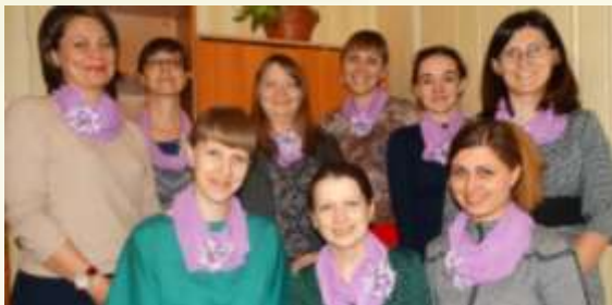
Авторский коллектив ГУ Забайкальский краевой центр «Семья»