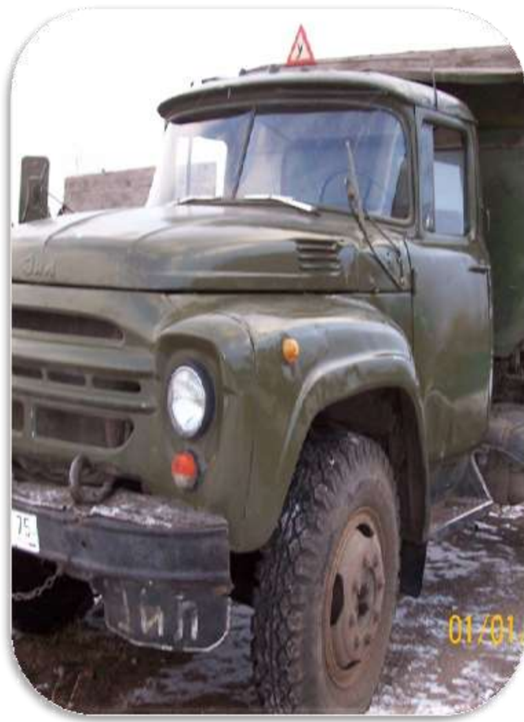
Учебная машина ЗИЛ