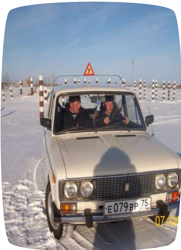
Учебная машина ЖИГУЛИ