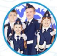
Юные инспектора движения