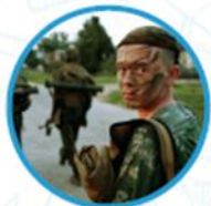
Юный спецназ Росгвардии