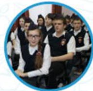
Юные помощники полиции