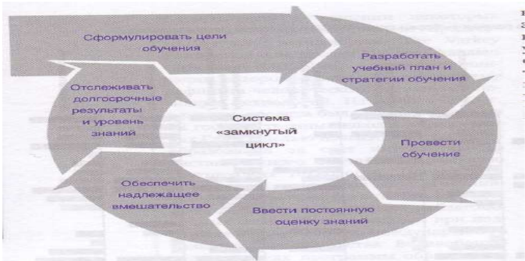
Рис. 6. Система обучения, известная как «замкнутый цикл», направленная на восполнение дефицита навыков